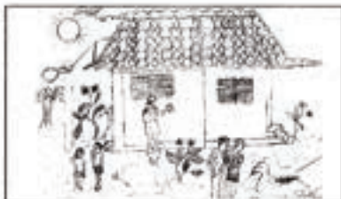
2º Prémio: Isnaba Jata 4ª classe Sala 3 E. B. C Bubaque

Um dia, anunciaram um concurso de salto às sete montanhas da tabanca de Foreá. O prémio era a filha do rei. O sapo e o pombo concorreram. A regra é saltar só com um pé. O sapo facilmente conseguiu vencer e levou a princesa. Viveram pouco tempo agradavelmete porque veio a fome. O pombo que já andava furioso desde aquela altura começou a cantar assim: